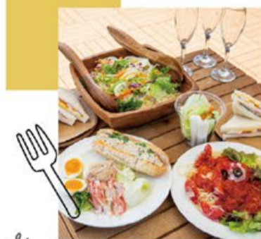
Garden dining 庭で育てた野菜で味も栄養も色とりどり!