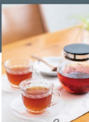
Enjoy tea party 自家製ハーブのお茶はいかが?

ライフスタイルや生活様式の変化を経て、リビングルーム の考え方が多様性を増してきた昨今の家づくり。家族が 楽しい、贈り場所としての役割はもちろみ、部屋の一角に テレワークや学習スペースを設けたり、壁一面ホワイト ボードにしてお絵描きをしたり、家族の個性が光るリビング ルームの空間提案を各モデルハウスでご紹介します。