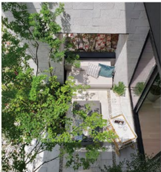
take a look beautiful brand new house in the housing plaza shinyurigaoka. by all means, please come!