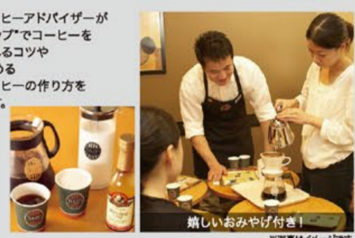
嬉しいおみやげ付き!