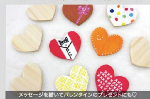
メッセージを描いてバレンタインのプレゼントにも♡