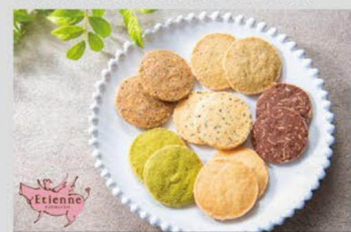
多彩なフレーバーが魅力的!サクサクでおいしい!

こだわりの素材を使った「クッキー」をご用意。 モデルハウスを見学の方に2枚セットでお贈りします。